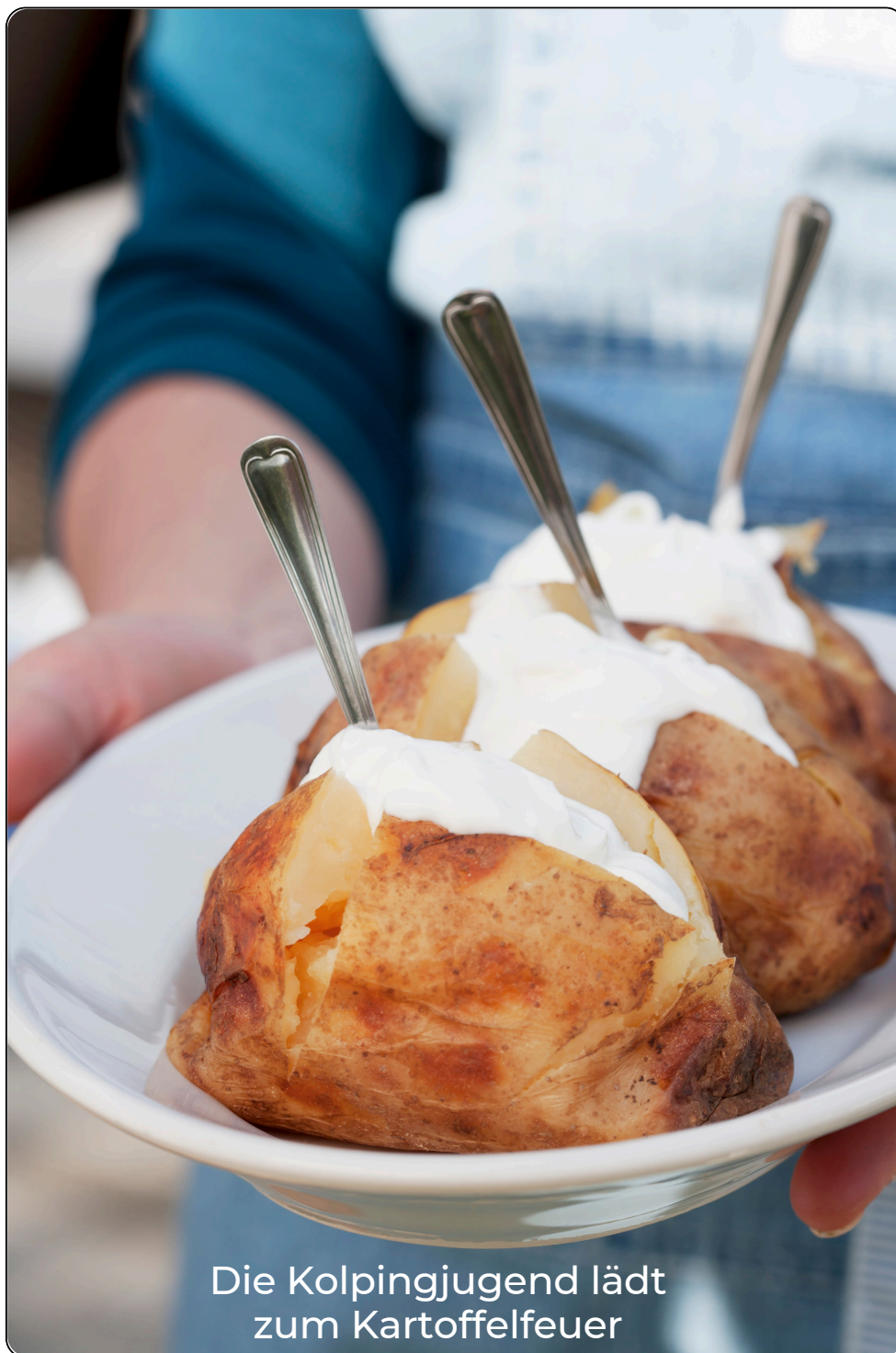
Die Kolpingjugend lädt zum Kartoffelfeier